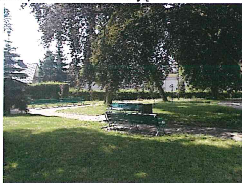
Czerwiec 2019 r.