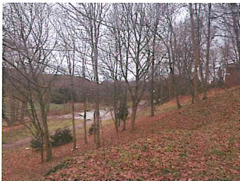
Grudzień 2021 r.